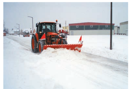
bema Schneeschild Serie 700, Schlepper (Dreipunktbock)