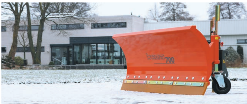
bema Schneeschild Serie 700 - verwindungssteifer Schildkörper