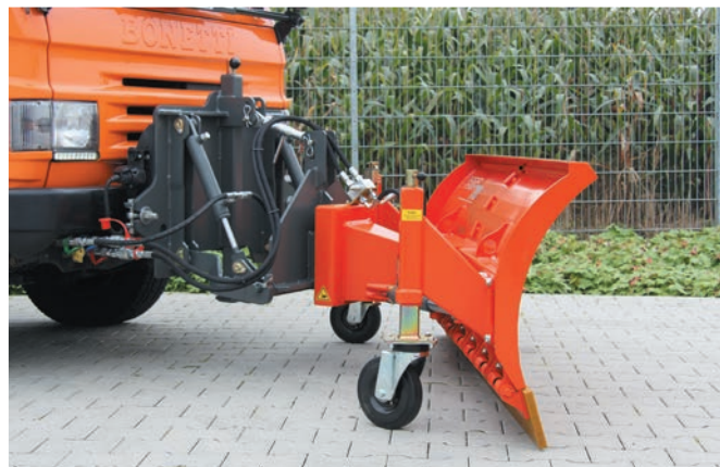
bema Schneeschild Serie 700 mit Hubeinrichtung für Winterdienstplatte