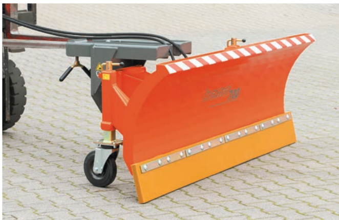
bema Schneeschild Serie 700, Gabelstapleranbau