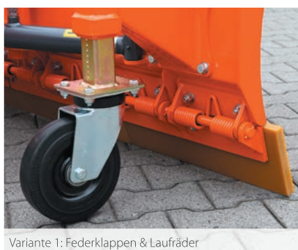
Variante 1: Federklappen & Laufräder