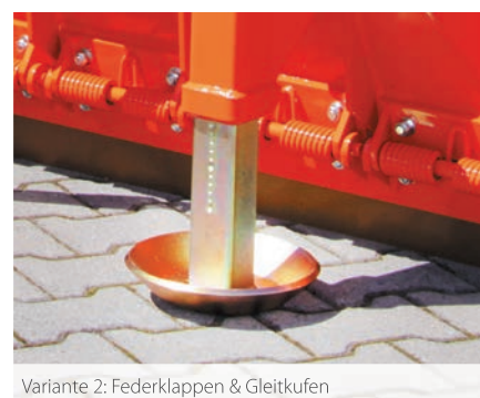
Variante 2: Federklappen & Gleitkufen